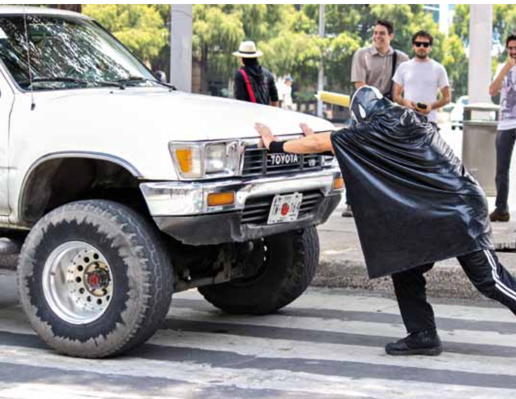
El luchador de los peatonales fait reculer les voitures pour libérer le passage piéton.

En Suisse, les obstacles rencontrés à pied sont surtout liés à l'inconfort ou à l'image de la marche dans nos esprits. Mais au Mexique, dû au manque d'infrastructures et de respect, marcher relève du parcours du combattant. Nombre de personnes se déplacent à pied et 500 piétons décèdent chaque année d'un accident de la route dans la capitale (contre 67 dans toute la Suisse). Face à cette triste réalité, Peatónito s'inspire de la lucha libre mexicana (sport de lutte) pour mener ses actions. Il peint des traversées et des trottoirs et rappelle à l'ordre les conducteurs. Rencontré lors de Walk21 à Vienne, il nous livre ses motivations.