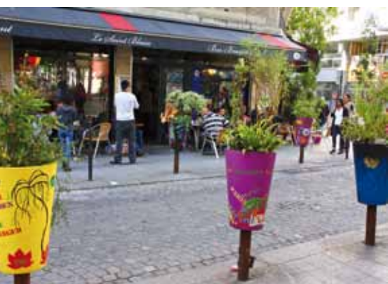
Rue Saint Blaise : les habitants participent à l'embellissement des espaces publics.

Le quartier Saint-Blaise , ensemble social très dense (record européen avec 75'000 hab/km 2 ) et mal desservi par les transports collectifs a été l'objet d'une restructuration menée avec la participation des habitants.