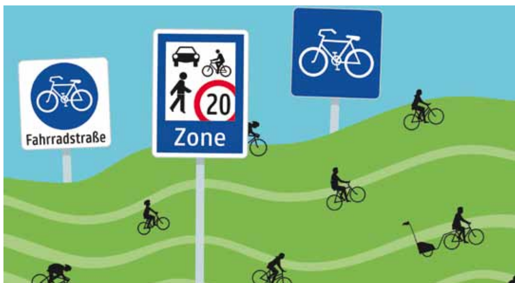
L'Autriche a développé 2 nouveaux outils pour promouvoir la bicyclette: la «rue cyclable» et le signal «aménagement cyclables recommandés», carré bleu ci-dessus à droite.

L'Autriche a publié son plan national vélo 2015 - 2025 (Masterplan Radfahren) en mai 2015. Il s'inscrit dans le programme