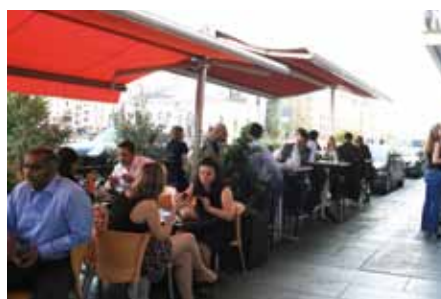
Profiter des bords du Rhône assis autour d'un verre plutôt qu'au volant de sa voiture? C'est possible, mais seulement du 1er mars au 31 octobre pour les terrasses sur places de parc.

On trouve une réappropriation, certes plus classique, mais également plus pérenne à Genève, où de nombreuses places sont transformées en terrasse le temps des «beaux» jours. Le gain en termes de convivialité est indéniable et la Ville de Genève affiche son soutien à cette pratique par le biais du «concours de la plus belle terrasse».