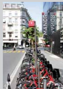
A Bienne, la Ville a opté pour un type de stationnement modulaire utilisé de façon uniforme dans tout le centre-ville, et a même développé un système de bikesharing qui s'y intègre.