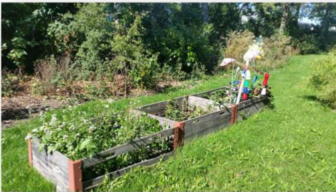
École de Villars-Vert