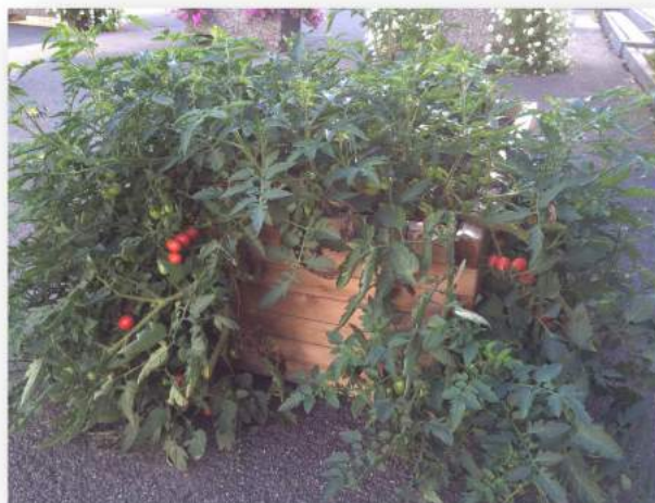
École de Cormanon

Mme Wuichet nous a fait part de son expérience faite avec des classes d'école enfantine à Villars-Vert. En effet 2 classes enfantines ont fleuri 8 bacs aux Eaux-Vives avec des fleurs comestibles et des herbes aromatiques. Ils ont enlevé les mauvaises herbes, cueilli les plantes et ont fait des amuse-bouche et autres mets. Ces deux classes ont aussi participé à la fête des Incroyables Comestibles en septembre 2014.