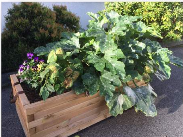
École de Cormanon