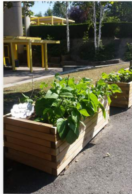
École des Rochettes